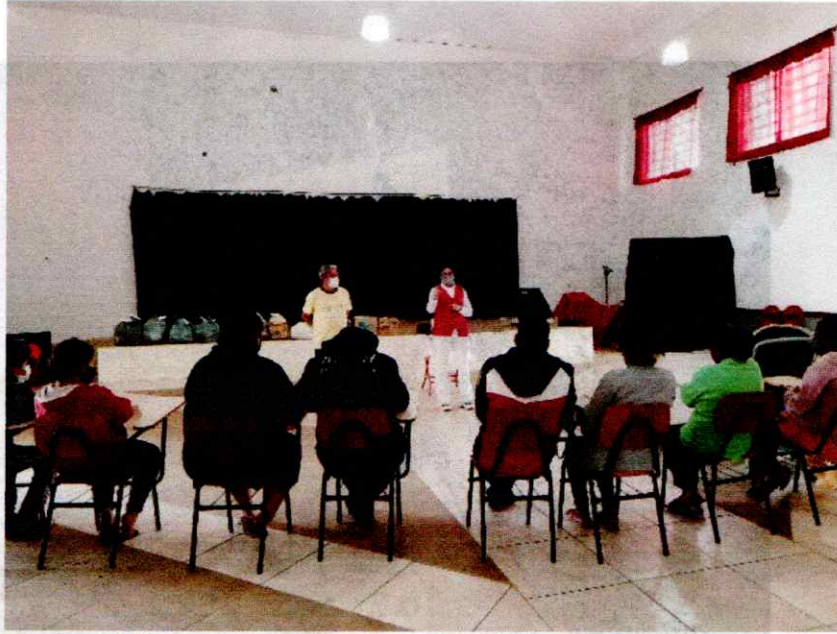
Na foto acima encontro com os alunos de graduação de nutrição e enfermagem no Cinedebate da Unitau para apresentação do documentário. Na foto seguinte, encontro com famílias cadastradas pela paróquia Sagrado Coração de Jesus para falar sobre o trabalho BLH Taubaté.