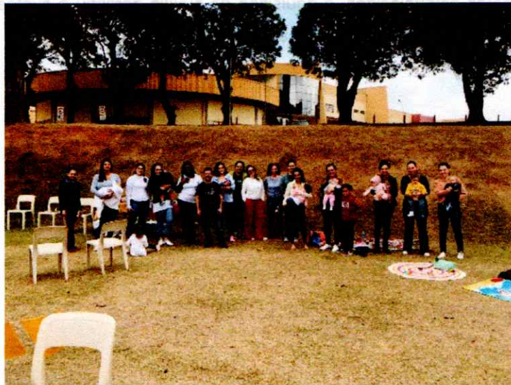
Encontro do "Mamaço", evento em comemoração ao Agosto Dourado- SEDES-Taubaté.