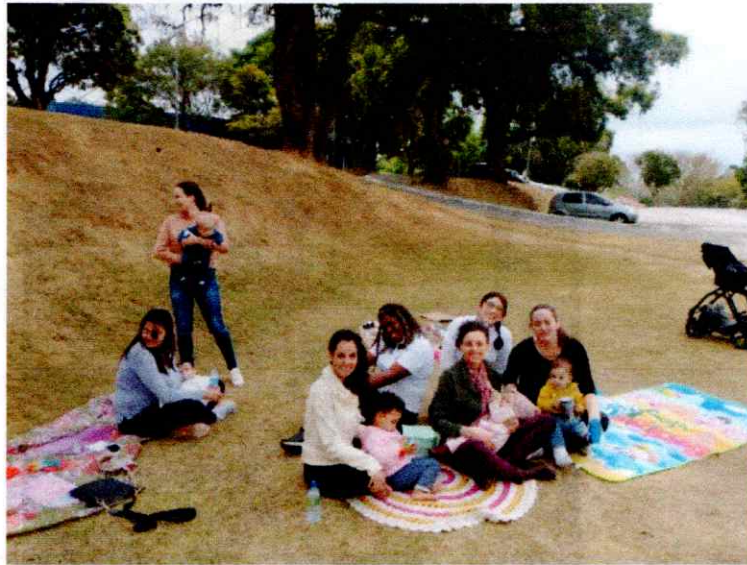
Encontro do “Mamaço”, evento em comemoração ao Agosto Dourado- SEDES-Taubaté.